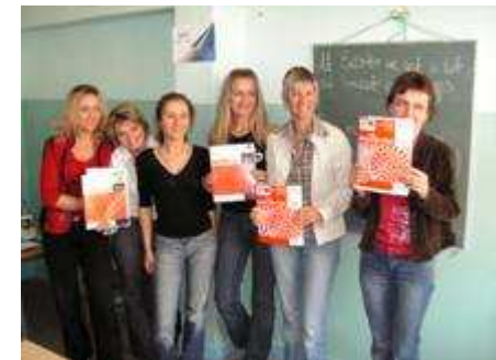
Kurs języka angielskiego – poziom średniozaawansowany