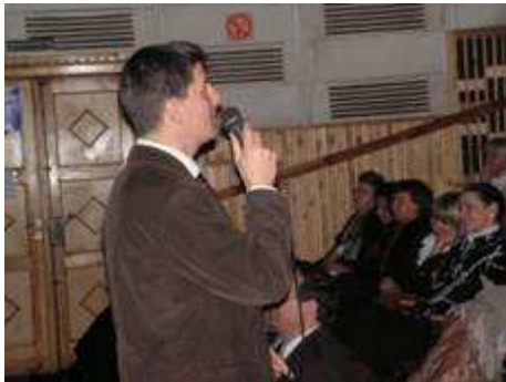
Konferencja „Równe Szanse”

Projekt zakładał objęcie 83 bezrobotnych kobiet, o niskich i zdezaktualizowanych kwalifikacjach zawodowych oraz chcących rozpocząć własną działalność gospodarczą, kompleksowym wsparciem doradczym, szkoleniowym oraz prozatrudnieniowym. Każda uczestniczka projektu przeszła rozmowy z doradcą zawodowym, pozwalające na określenie predyspozycji, umiejętności i dobranie odpowiedniej pomocy do rzeczywistych potrzeb beneficjentów. Dzięki dofinansowaniu projektu ze środków Europejskiego Funduszu Społecznego, możliwe było przeprowadzenie konferencji informacyjno –