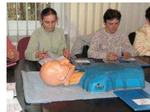
Szkolenie: Opiekunka osób starszych, chorych i dzieci

Dużym zainteresowaniem wśród uczestników projektu cieszyły się przygotowania zawodowe, odbywane w miejscu pracy przez okres około 6 miesięcy. Przygotowanie zawodowe pozwala długotrwale bezrobotnym zdobyć niezbędne w dalszych staraniach o pracę doświadczenie i praktykę zawodową. Umożliwia nabycie nowych i uaktualnienie dotychczasowych kwalifikacji zawodowych poprzez praktyczne wykonywanie zadań zawodowych na stanowisku pracy. Wraz ze szkoleniem wyrównawczym oraz zawodowym umożliwia łatwiejszy i łagodniejszy powrót osób długotrwale bezrobotnych na rynek pracy. Codzienne chodzenie do pracy, wykonywanie obowiązków, otrzymywanie stypendium z tytułu odbywania przygotowania podnosi poczucie wartości oraz rozbudza motywację do pracy bądź jej poszukiwania. Wiara w siebie i swoje możliwości daje szansę na zmianę dotychczasowego stylu życia z pasywnego na bardziej aktywny.