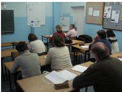
Szkolenie wyrównawcze - zajęcia z psychologiem

Funduszu Społecznego, tj. wspierania rozwoju lokalnego, zapewnienia równości szans na rynku pracy, rozwoju społeczeństwa informacyjnego oraz zasady zrównoważonego rozwoju. Efektem realizacji projektu jest zaktywizowanie zawodowe 71 osób bezrobotnych zagrożonych wykluczeniem społecznym oraz zawiązanie partnerstwa lokalnego na rzecz działań dla osób w szczególnej sytuacji na rynku pracy. Projekt jest próbą przezwyciężenia niekorzystnej sytuacji zawodowo – społecznej bezrobotnych oraz zmiany dotychczasowego pasywnego stylu życia na bardziej aktywnej.