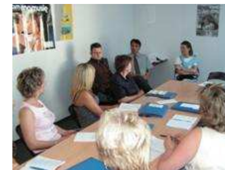
Szkolenie opiekunek osób starszych, chorych i dzieci