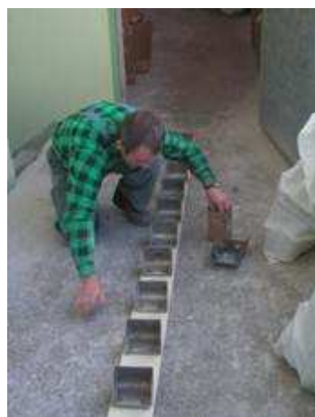
Przygotowanie zawodowe w zakładzie przetwórstwa zbożowego

Aby dokonać zmiany nastawienia potencjalnych pracodawców do osób pozostających bezrobotnymi przez dłuższy okres czasu, projektodawca zorganizował dla uczestników projektu szkolenia zawodowe, które miały na celu nabycie nowych lub aktualizację dotychczasowych kwalifikacji. Beneficjenci ostateczni mogli skorzystać ze szkoleń: kucharz małej gastronomii, szwaczka tapicerska, kurs komputerowy ze specjalnością graficzną z zakładaniem stron internetowych, kurs komputerowy ze specjalnością księgowo – magazynową, operator wózków jezdniowych oraz opiekunka osób starszych, chorych i dzieci.