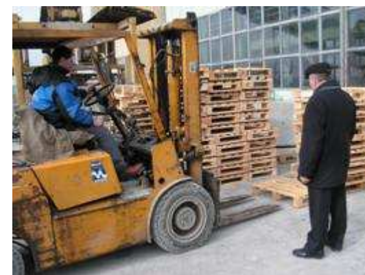
Zajęcia praktyczne z obsługi wózków jezdniowych