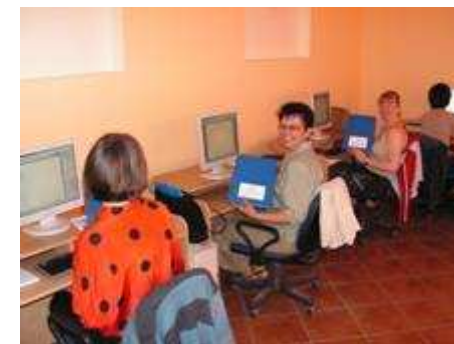
Zajęcia praktyczne na kursie komputerowym I stopnia

Uczestniczki projektu, które nie miały wizji otwarcia własnego biznesu i nie skorzystały z możliwości odbycia przygotowania zawodowego w miejscu pracy, zostały objęte warsztatami aktywizacyjnymi. W ich trakcie uczyły się samodzielnego przygotowywania dokumentów aplikacyjnych (życiorys, list motywacyjny) i odpowiedniego sposobu uczestnictwa w rozmowie kwalifikacyjnej. Przekazano im także informacje na temat: Unii Europejskiej, Europejskiego Funduszu Społecznego, wolontariatu i poszukiwania pracy przez Internet. Warsztaty pozwalają na przygotowanie uczestników do poszukiwania pracy na otwartym rynku pracy.