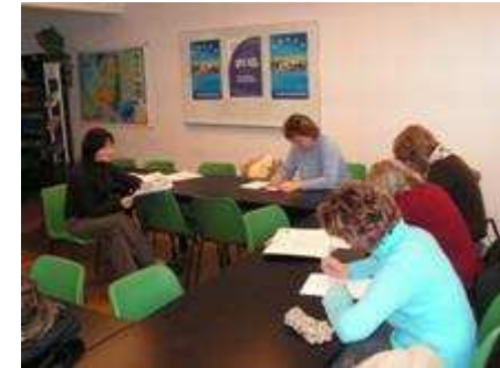
Spotkanie uczestniczek projektu z doradcą zawodowym

edukacyjnej „ Równe Szanse ” skierowanej do kobiet, pracodawców oraz władz lokalnych. Jej tematem przewodnim było zwalczanie stereotypów w postrzeganiu ról kobiecych i męskich w życiu zawodowym i społecznym. Organizując to przedsięwzięcie zapoczątkowano dyskusję społeczną na ten temat. 80 uczestniczek projektu skorzystało ze szkoleń zawodowych o profilach ustalonych wcześniej z doradcą zawodowym, tzn.: opiekunka osób starszych, chorych i dzieci, kurs przygotowujący do rozpoczęcia działalności gospodarczej, kurs komputerowy księgowo – magazynowy, kurs komputerowy I stopnia, kurs krawiecki – krawiectwo lekkie, kurs podstaw języka niemieckiego, kurs podstawowy języka angielskiego, kurs średnio zaawansowany języka angielskiego. Po szkoleniu 30 osób zakwalifikowanych zostało do odbycia przygotowania zawodowego w miejscu pracy, 13 osób otrzymało jednorazowe środki na rozpoczęcie działalności gospodarczej, a pozostałe uczestniczki zostały objęte warsztatami aktywnego poszukiwania pracy, które były realizowane przez Klub Pracy działający przy Powiatowym Urzędzie Pracy w Wągrowcu.