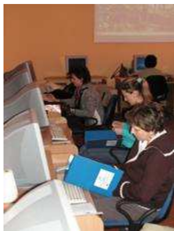
Kurs komputerowy specjalność graficzna