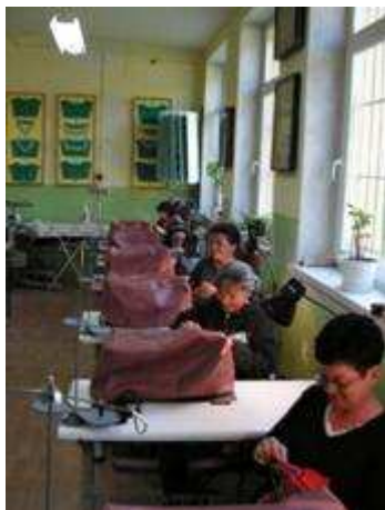
Zajęcia praktyczne na kursie szwaczka tapicerska

Uczestniczki projektu korzystające z przygotowania zawodowego nabywały nowe umiejętności teoretyczne i praktyczne w miejscu pracy, miały możliwość: poprawy swej złej sytuacji materialnej, przerwanie długotrwałego pozostawania bez pracy i przełamanie niechęci pracodawców. Przygotowanie zawodowe dla beneficjentek projektu zorganizowane zostało w: zakładach produkcyjnych, handlowych i usługowych (branża krawiecka, przemysłowa, spożywcza, drzewna), urzędzie skarbowym, ośrodkach pomocy społecznej, ośrodku sportu i rekreacji, komendzie powiatowej policji, hotelu, zakładzie ubezpieczeń, bibliotece publicznej, spółdzielni mieszkaniowej oraz zakładzie opieki zdrowotnej.