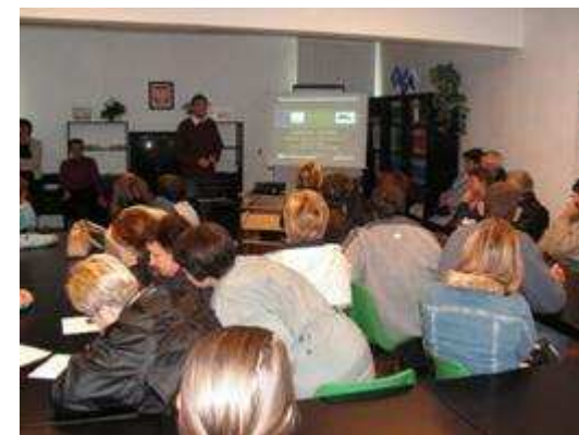
Spotkanie informacyjno – rekrutacyjne

Podczas realizacji projektu dla wszystkich uczestników przeprowadzono innowacyjne szkolenie wyrównawcze z: warsztatami aktywnego poszukiwania pracy, udziałem psychologa i kursem obsługi komputera. Szkolenie to spełniało rolę narzędzia kompensującego brak kontaktu z technikami informacyjnymi i środowiskiem pracy. Dzięki działaniom warsztatowym uczestnicy projektu nabyli kluczowe umiejętności pracownicze, poznali metody autoprezentacji i poszukiwania pracy.